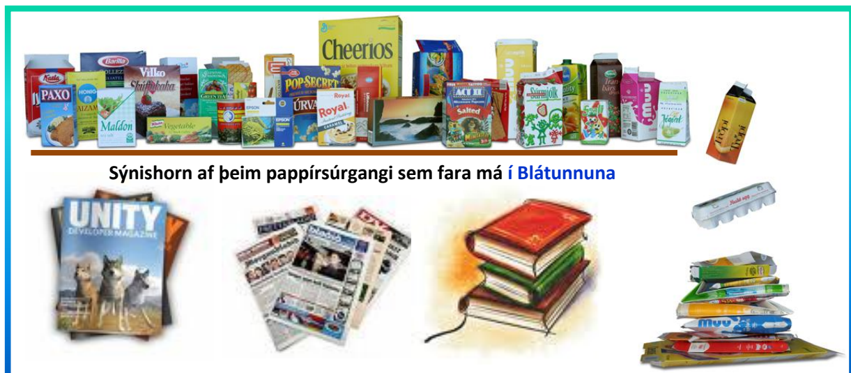
Sýnishorn af þeim pappírsúrgangi sem fara má í Blátunnuna

Blátunnan er skilgreining á íláti undir pappírsúrgang frá heimilum. Um er að ræða dagblöð, tímarit, auglýsingapóst og prentpappír. Einnig hreinar og tómar umbúðir úr sléttum pappa eins og fernur, morgunkornspakka, eggjabakka og pakkningar utan af matvælum eins og kexi og pasta. Gæta verður þess að skola þær fernur sem fara í Blátunnuna og leyfa þeim að þorna áður en þær fara í ílátið. Blátunnan er með bláu loki og er hún hirt á 8 vikna fresti.