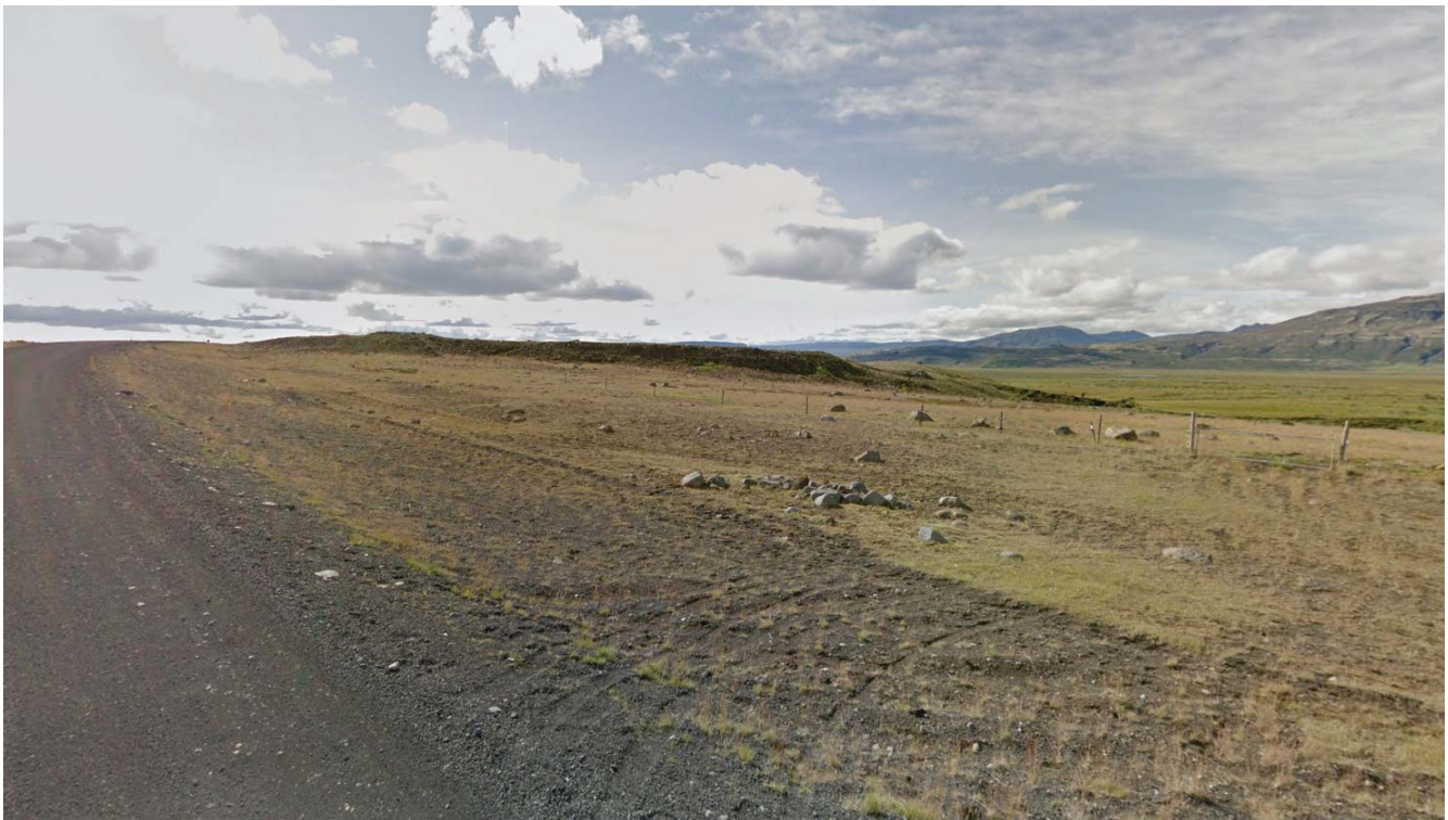
Mynd 2. Yfirlitsmynd af væntanlegu skipulagssvæði og nágrenni.

Aðkoma - Aðkoma er frá Einholtsvegi (358), um veg sem lagður verður inn á skipulagssvæðið. Fullt samráð verður haft við Vegagerðina um uppbyggingu nýs aðkomuvegar og tengingu við Einholtsveg. Veitur og sorp - Byggingar á skipulagssvæðinu munu tengjast inn á rafveitukerfi Rarik. Borað hefur verið fyrir köldu vatni á landinu og verður það með uppdælingu notað til neyslu og upphitunar húsa með varmaskipti. Lagnir verða lagðar með aðkomuvegi. Fráveituvirki verður staðsett NA af fyrirhuguðu íbúðarhúsi. Sorphirða verður samkvæmt reglum sveitarfélagsins. Fornleifar - Minjastofnun Íslands verður sendur uppdráttur af skipulagssvæðinu og óskað eftir umsögn stofnunarinnar um væntanlegar framkvæmdir.